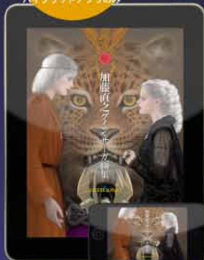
加藤直之 グイン・サーガ原集 (600円)