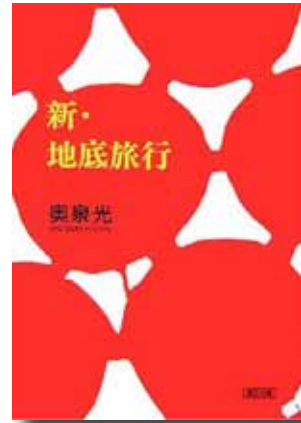
新・地底旅行 奥泉光 朝日新聞社 ISBN-13 : 978-4022643933

事実、サイバーパンクの出発点を示すことで、逆説的に現代におけるスチームパンクの意義を決定づけたウィリアム・ギブスン&ブルース・スターリングの『ディファレンス・エンジン』は、旧来のテクノロジー、ひいてはそれを可能にした社会状況の「読み直し」を体現した作品となっていた。そして、漱石のスタイルを採用した『吾輩は猫である』殺人事件（奥泉光）を引き継ぐ形の『新・地底旅行』においては、一癖も二癖もある『猫』の登場人物ゆかりの者たちが活躍する。しかしそれは、単なるスター・システムに留まるものではない。作品全体が大胆な先行