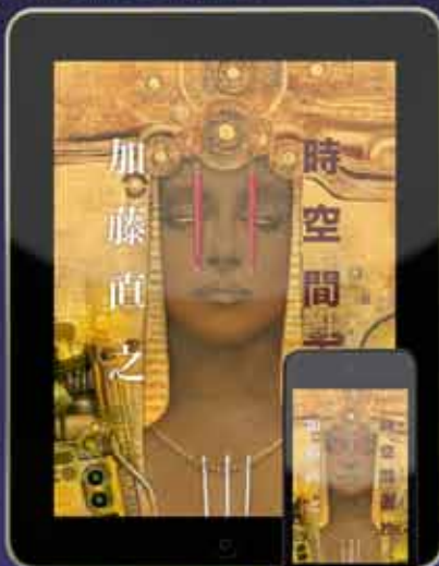
加藤直之 『時空間』 (600円)