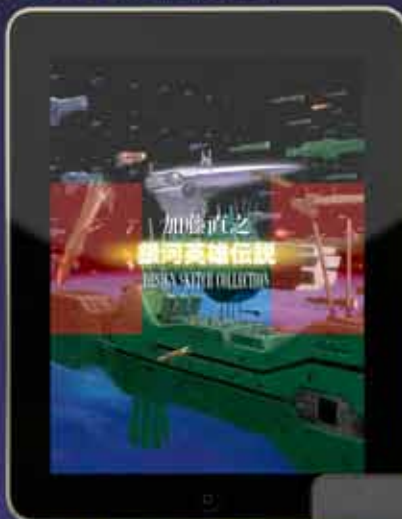
加藤直之 『銀河英雄伝説』メカ設定集 (600円)