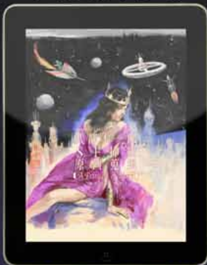
武部ホー太郎 『火星のプリンセス』原画集 (無料)