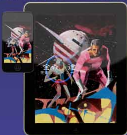
金森 達 『宇宙のスカイラーク』原画集 (250円) 金森 達 『奥句画記』2001~2010 (予定600円)