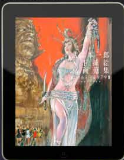
武部ホー太郎 SF原画原画集 (1500円)